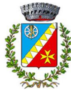
Comune di Rodi Milici