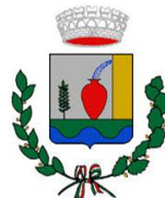
Comune di Terme Vigliatore