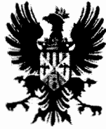
Comune di Castoreale