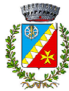
Comune di Rodi Milici