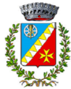
Comune di Rodi Milici