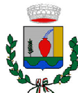
Comune di Terme Vigliatore

Ente Appaltante: Comune di Terme Vigliatore (ME)