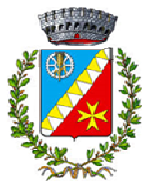
Comune di Rodi Milici